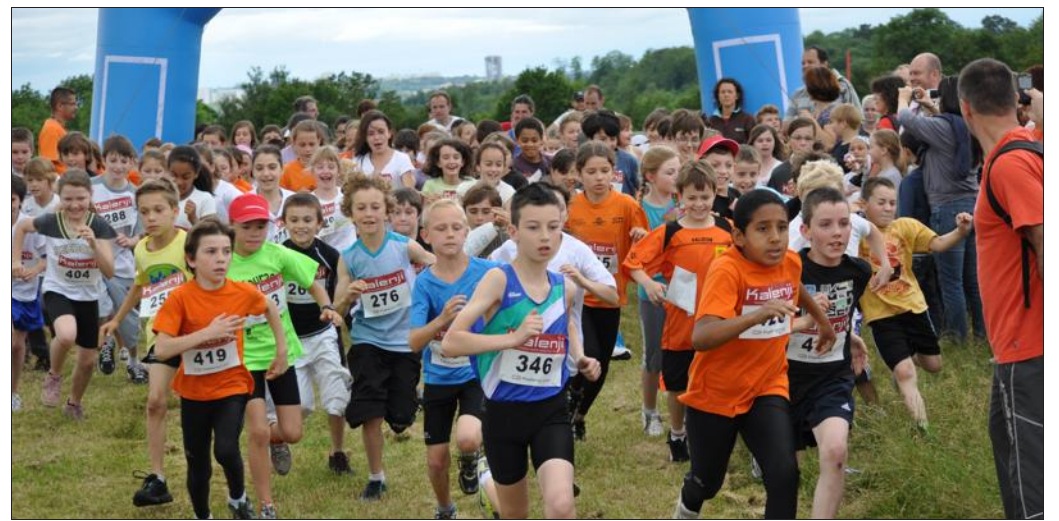
■ Les enfants étaient nombreux à ce deuxième cross du genre.

Rendez-vous pour la 3e édition avec, on l'espère, une affluente encore en hausse !