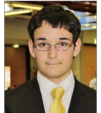
■ Un parcours sans faute pour le jeune Seichanais.

Son aisance et ses qualités reconnues, il a été désigné pour être arbitre central lors de trois combats en finale cadets. C'est maintenant la 5e fois qu'il arbitre au niveau national. Actuellement, en fédéral, il est F2 stagiaire (de niveau régional). Il sera titularisé dès l'obtention de sa