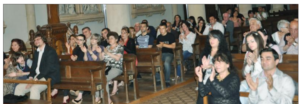
■ Les mélomanes ont applaudi les deux artistes arméniens.

La pédagogie musicale est très différente en Arménie paraît-il alors l'association