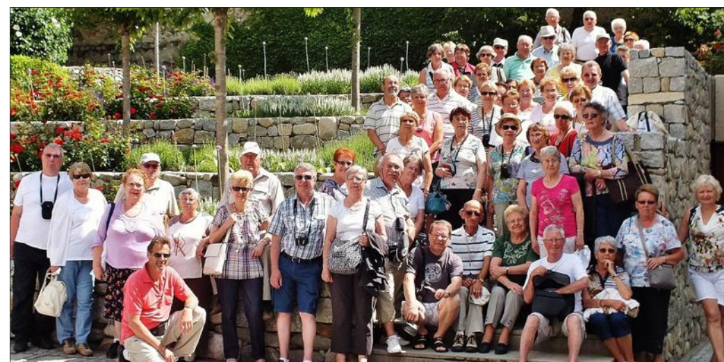
■ Un beau voyage en Italie pour soixante-deux retraités.

Les voyageurs ont pris ensuite la direction des Dolomites, après un arrêt déjeuner au bord du lac de Garde. Visite de Novacella et son monastère, puis Bressanone, ville moyen-âgeuse et