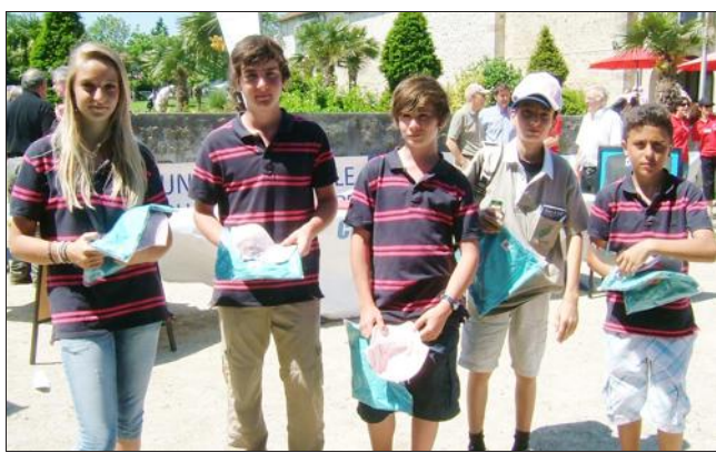
■ Les jeunes golfeurs du collège Edmond-de-Goncourt.